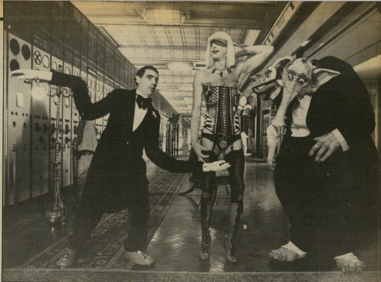
פרס מיוחד — "משמעות החיים" של מונטי פיטון חיוך מטורף בים עגמומי