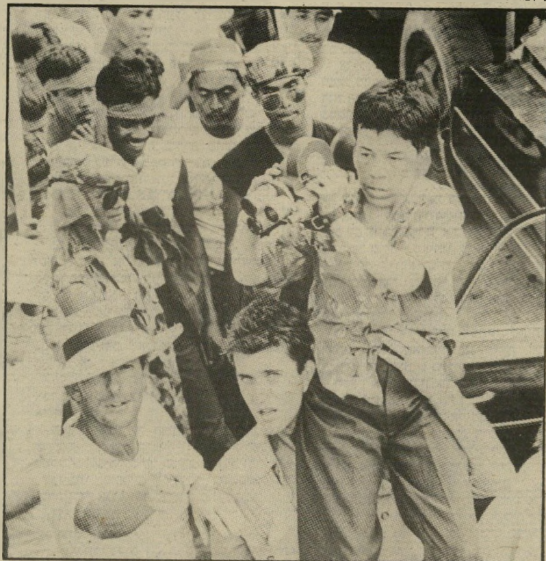
פיטר ווייר מביים "שנה של חיים מסוכנים" אינדונסיה במצלמות המערב

חסר. אחרי הפגנות הסטודנטים לרפואה היו הפגנות של גולים תורכים נגד המישטר בבית וזאת משום שסרט של הבימאי התורכי הגולה אילמו גיני נכלל בתחרות. היתה אפילו כהלת