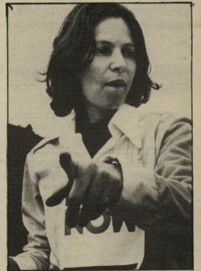
חוקרת גרין לאן נלך אנחנו?

...אמש במקום הזה היו הרבה הגלים אדומים (בוז) היום יש פה הרבה דגלי תבלת לבן (תרעות). זהו ההבל המזפרי, הדיספורי האיריאולוגי. בינינו לבין המערך הסוציאליסטי (בוז). הם עדיין לא למדו, מה מסמל הדגל האדום בתקופתנו. זהו הדגל של הטרור-נאציזם (בוז). אבל על הנאציזם לא אדבר הלילה. אדבר על הקימונים (בוז). זה הדגל של שיגאת ישראל. ואספקת נשק לכל אויבי ישראל מסביב (בוז). זה הדגל של רדיפת היהודים ורדיפת העברית. זה הדגל של מחנות ריכוז וריכוז הארם. זה הדגל של השיעבוד, של האובה, ואת הדגל הזה אמש הניסו אלה שהדבאו מכל קצוות הארץ