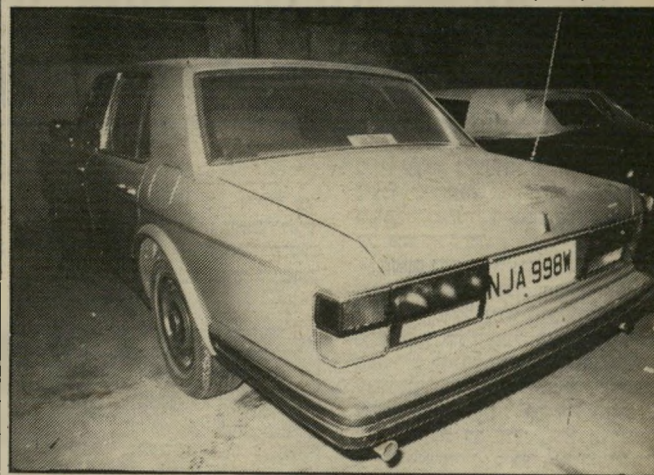
מכוניות הרולס רויס "דה-אוסטיין" מכורה לערב הסעודית

"חשוב ביותר למנוע את ההרגשה כי הליכי בית-המישפט הם "מישחק של מזל", שבו התוצאה נקבעת על-ידי גורמים מיקריים ושרירותיים, ואת עירעור האימון במערכת המישפטית העלול להיגרם על-ידי הרגשה כזאת". בית המישפט העליון השווה את שתי החלטות ושיחרר גם את מורשו של עורך-הדין יפתח בערכות.