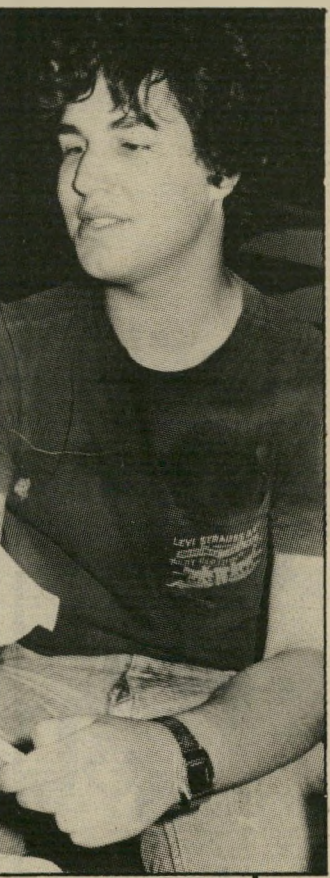
שמיניסטים בקינולו, אלרואי ורר התלבטויות ויסורי מצפון אינם מנקים איש