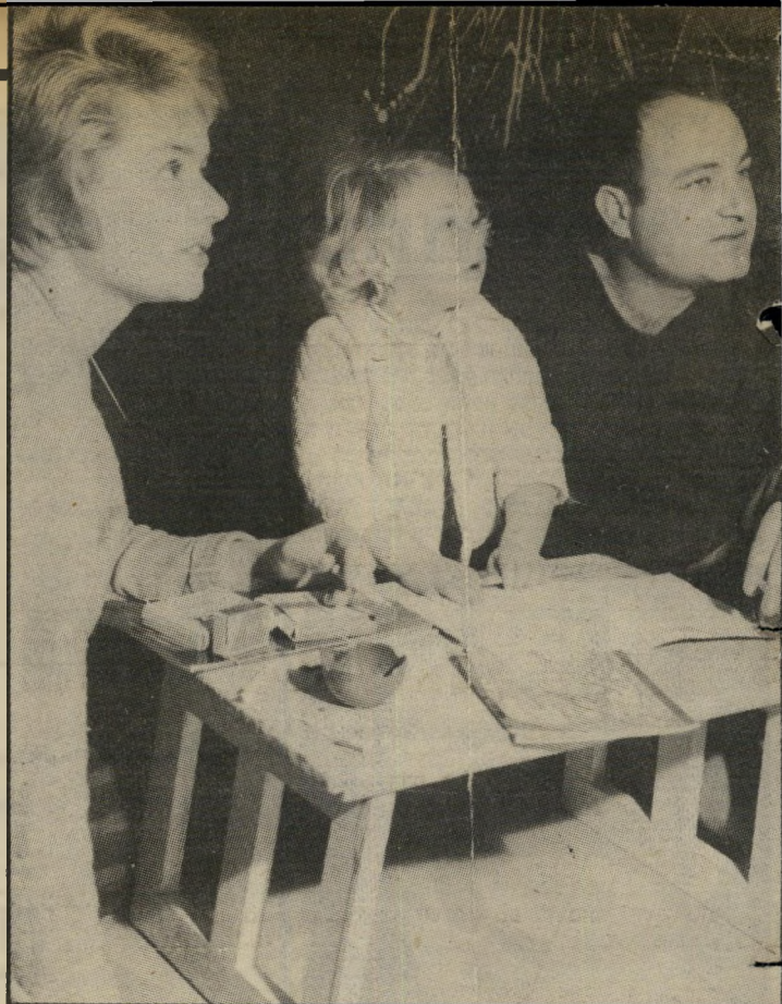
עם אשתו ובתו לחתגרש בהתכתבות?