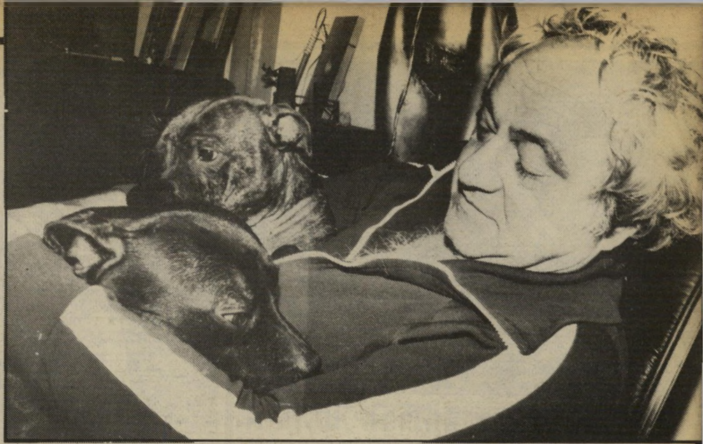
תומרקין בבית הבולוי הכי טוב

הרה היא טיפוס זעיר-כורגני כעל חלומות, שהיום זה נראה מצחיק. היא רוצה להיות שילוב של מניה שוחט עם וירג'יניה וולף. כיום שזה יקרה, נוכל לערוב את האש עם המים.