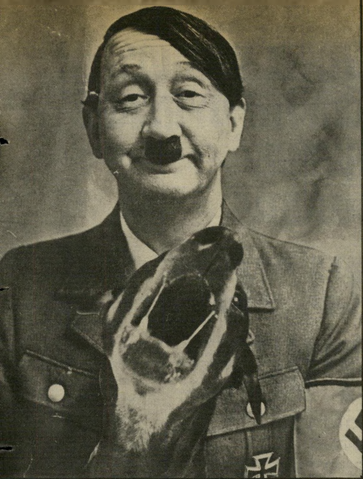
מתחזה להיטלר השחקן הבריטי הני יונגמן

ראתה כבר לפני 10 שנים כי הפיתרון לבני העם הפלסטיני היא מדינה פלסטינית. אולם כד כבר אסור לשכוח. שאותה אישיות העדיפה את הגלות בארץ הברבארים.