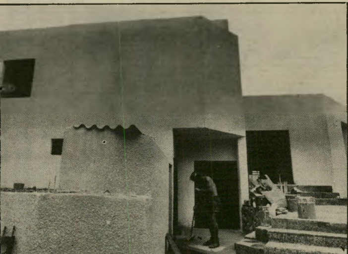
ווילת-המריבה באילת אלפיים דולר

נוימן החל למלא את תפקידו הציבורי, אך בתוך זמן קצר מצא את