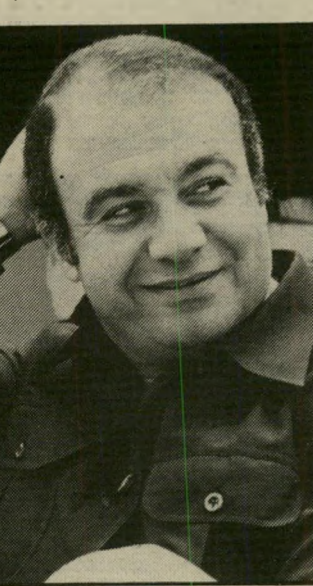
קונסול עיסא לא משלם

רוצים אופציה לקניית הרירה וזה מה שקסם לי. אני רציתי חווה לארכע שנים ואחרי ששמעתי שהם אולי יקנו את הרירה עשינו חווה לשנתיים. המחיר שנתתי להם אז היה נמוך ממחירי וילות אחרות. עכשיו, כש המצב קשה ואחרים משכירים בנחות ממני, הם רוצים שאני אוריד להם את המחיר?"