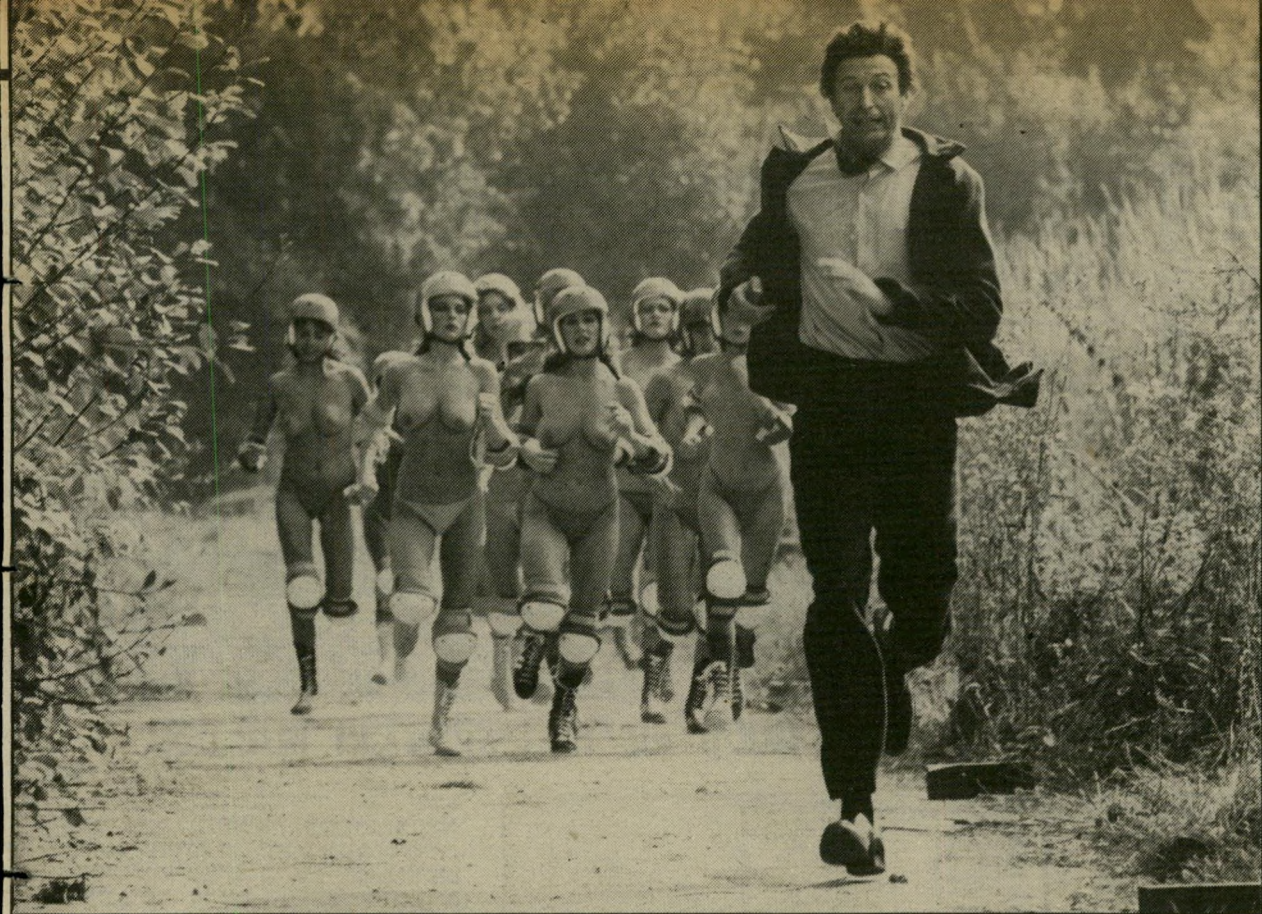
הסרט המצחיק של מונטי פיטון "משמעות החיים" סיוט ו/או חלום

אלא שמשום מה איש אינו מעז לכנות את היצור החדש, ארמון הפסטיבלים, כשמו הרשמי. מתייחסים אליו כאל ה"בונקר", מזכירים את