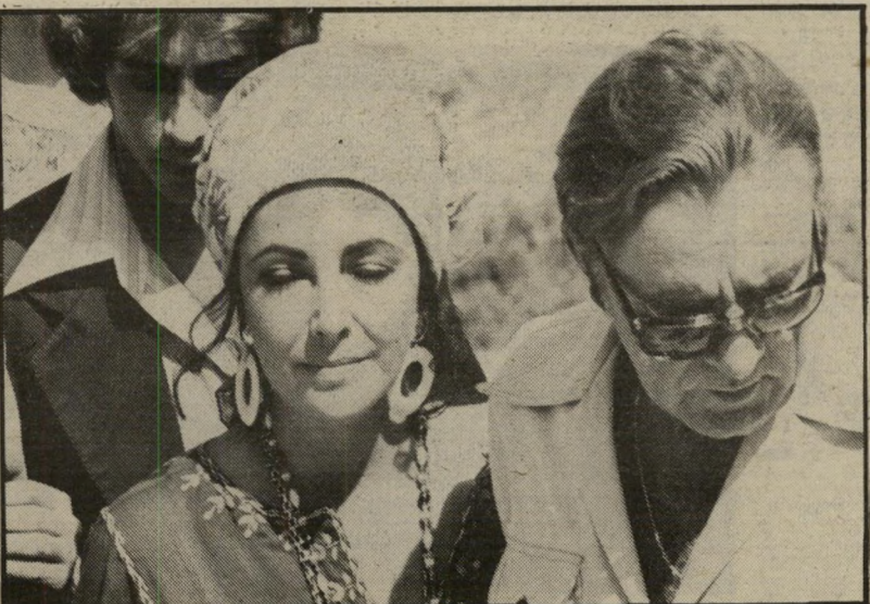
ריצ'רד ברטון וליז טיילור מיפגש מחודש

אך הביקורת בנוסטון קטלה אותה והיללה את ברטון. הביקורת בניו-יורק כנראה תהייה דומה. זה לא הפריע למוכרי הכרטיסים למכור זוג כרטיסים ב־90 דולר. העיקר שיש מי שמוכן לשלם.