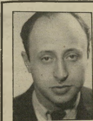
קורא פרידלר בנקרוט בבורסה

ידעתי מה לעשות / סוף-סוף עליתי על הגל / והחלטתי לקנות בל"ל. הסוף ידוע לכל / יותר טוב לא לשאול / אני פשוט בנקרוט / כי הייתי. לא עליכם. אידיוט / מהכסף שלי היתה פסולת / כי בבורסה מוסר-השכל מן הנ"ל / אם אתה אביון ודל / שב בבית בנחת בבורסה / ואל תחפש מטמון בבורסה.