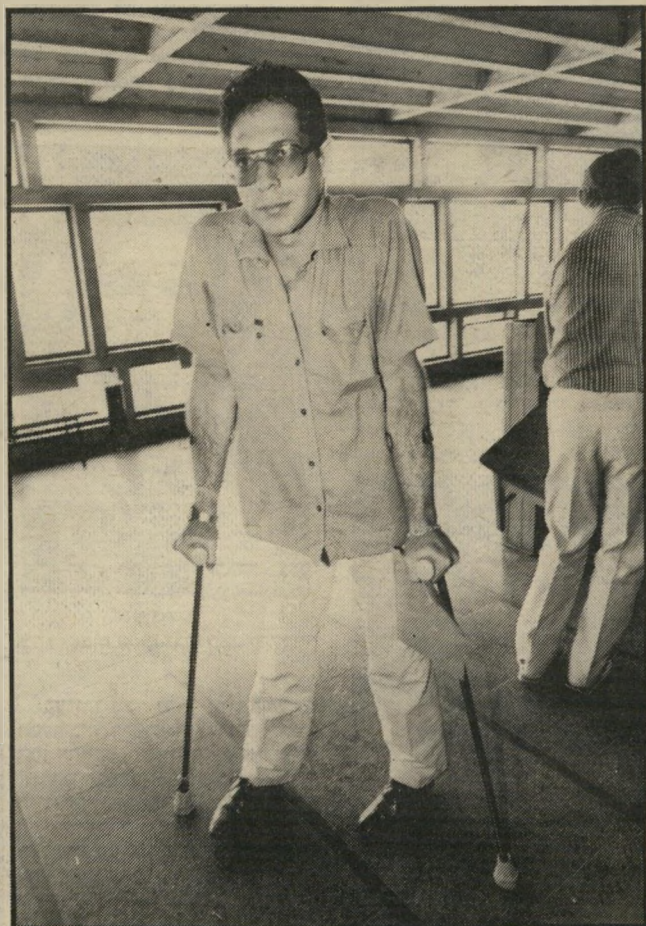
עד האובן שוחד מיני