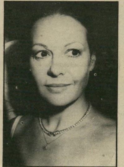
שחקנית אלמגור הכלב גנב את ההצגה

● לכתב הטלוויזיה גיל סרן, על כתבת מבט שני שהכין בנושא ניקמת-הדם בניכור