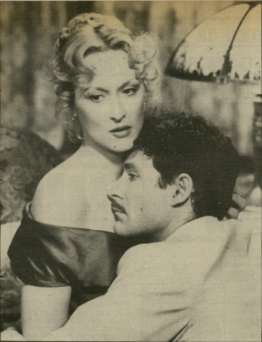
מריל סטריפ בתפקיד סופי עם קווין קליין סופי עם המאהב בסרט

שרבכני הוליווד לרכך ולעדן את הסיפור האלים והקיצוני, על עבר כושי אשר קם יום אחד ורצח עשרות לבנים (סיפור אמיתי בהחלט!), ומצד שני