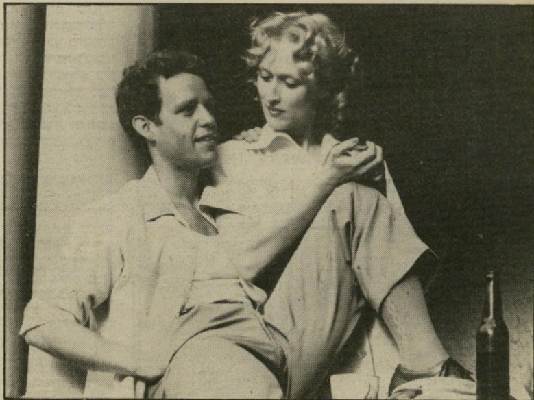
סטריפ עם פטר מקניקול בתפקיד סטינגו סופי עם הסופר בסרט

ספרותי מדי! "זה נכון שבמיקרה זה הספר היה פחות שנוי במחלוקת, מסביר סטיירון. מה שנכון עוד יותר הוא, שלהבריל מן המיקרה הקודם, כימאי הסרט — שכתב גם את התסריט — אלן ג'יי פאקולה, פנה אישית אל הסופר לפני שהתחיל בכתיבת התסריט. התייעץ עימו בשעת הכתיבה, שמח לקבל פניו בביקוריו המעטים על בימת הצילומים — ובכלל, התייחס למקור הספרותי בכל-כך הרבה כבוד. שיש הטוענים כי זה חסרונו העיקרי של הסרט: הוא ספרותי מדי. "קראתי את התסריט והוא ניראה לי מאוד."