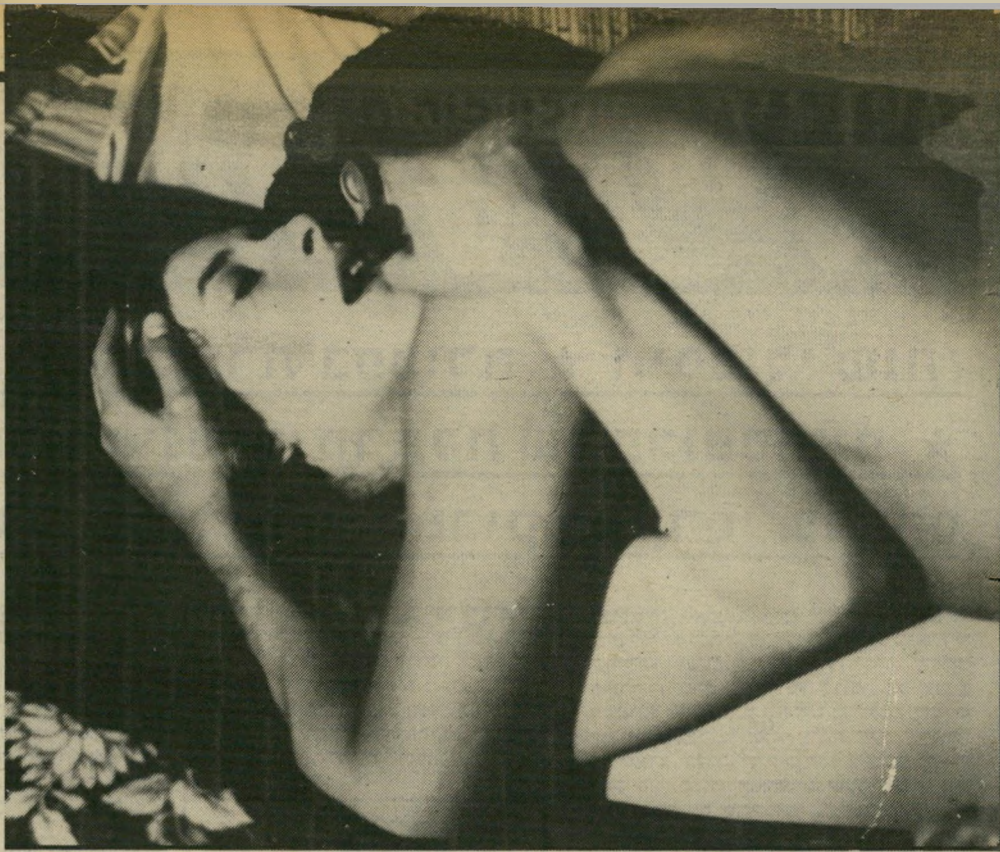
טען, שבגלל התמונות הנועזות מהסרט יוצאים קבוע, איימה אבון להתאבד. הבימאי נאלץ להוציא את הסצנה מהסרט, אחרי שהיא זכתה במישפט.

בית המשפט, שלקח בחשבון גם טענות נוספות, התרשם מאוד מן טענה זו, והחליט לזכות את אסידוב מכל אשמה — למרות שהקורבן נותר בחיים.