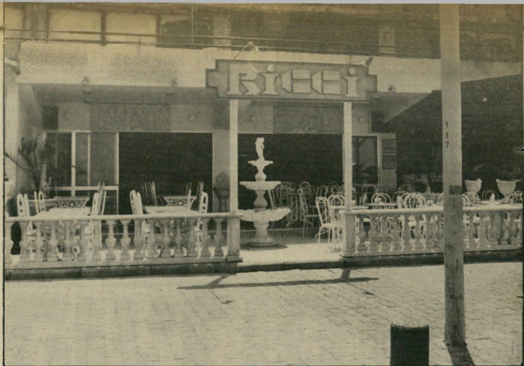
מירפסת להריסה – המזרקה כבר נעלמה. במסעדה המזרחית, בתמונה למטה, החלו בהסרת המעקים. שטחי המירפסת מיועדות בעתיד למעבר להולכי-רגל. לא אשקיע יותר יותר בטיילת! אמר השבוע כץ המיואש.