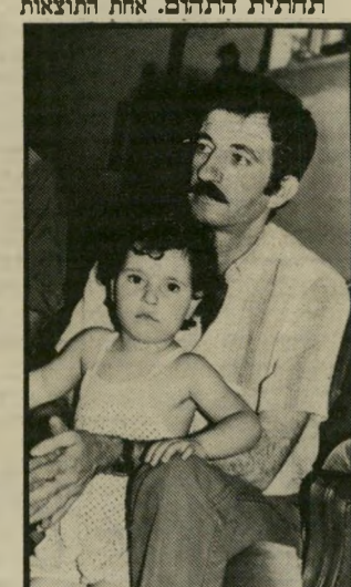
אישה אש"ף שקור המגעים יימשכו!

הם ישנם, ותהיה זאת איולול מצד כל גורם שהוא במרחב להתעלם מכך.