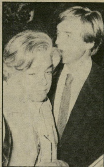
סימון סיניורה האשה

בספר הזיכרונות שלה מספרת מספרת סימון סיניורה שהיתה נשואה כשהכירה את איב מונטאן. בתוך ארבעה ימים מהרגע שהכרנו, התרחש ביננו משהו מהמם ובלתי-צנוע. לפחות לגביי זה היה דבר שאחריו אין חזרה. עכשיו זה מזכיר את הסרט המעגל. צחוק הגורל מר, אבל זאת האמת.