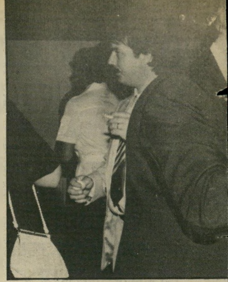
מוסיאון. ראש-העירייה עסוק בצלחתו, ורקנאטי צ'יץ. בנאומו לתורמים שבאו לחגיגה הירבה להט מבחינה תקציבית, עדיף שאדבר אליכם בדולרים."

"בשעה 8 וחצי נפתחה דלת ביתי, ובנה אחר זה פלש עדר של 500 איש, ומילא את כל חמש הקומות של הבית. נכנסו לי לכל הדרייה-שינה.