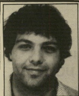
קורא יסקין יזכור - למדינה

של האימן (העולם הזה 2379). האימן איננו "כת", ובוודאי לא "תימהונית". חברי האגודה הם אנשים חופשיים, אשר מצאו בה את המיסגרת הטובה ביותר לקיום אורח-חיים שבו כהרו. האגודה שוקדת על לימוד חוקי היקום והטבע, תוך הרגשת מקומו ותפקידו של האדם בחברה ותוך מתן אפשרות לכל פרט בתוכה לשיפור עצמי ולמיצוי מירבי של יכולתו