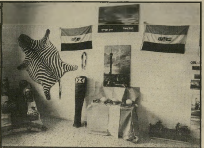
תצוגת דרום-אפריקה בבית-הספר אנחנו בעד שיויון!

קה. מילאתי צורך אנושי. אחרי אירוע דרמאטי זה סערו הרוחות בקרב התלמידים. חלקם פחדו לדבר וחששו לחשוף את עצמם לעיתונות. רובם קיבלו את ההסבר כי לא נאה לפגוע באורי- חים כשהם נמצאים בביתך. אך רוב התלמידים לא הבינו כלל על מה קמה כל הסערה, מכיוון שאיש לא טרח להסביר להם בשבוע דרום-אפריקה, מהי בעצם מדינה זו ומהו מישטר האפרטהייד המוני- עצנת סרגוסטי