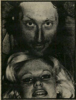
פוכן ישראלי וידידה עבר מישטרה