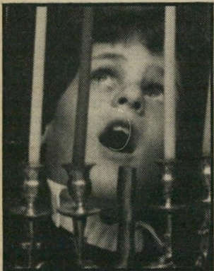
חוגג נבון שתי מסיבות

זכה ♦ בפרס הספרות הבינלאומי לשלום לשנת 1983 הסופר היהודי-אמריקאי עטור-הפרסים אלי