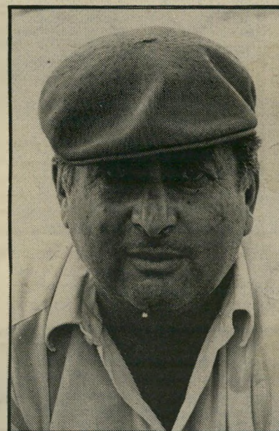
דיוקנאי שמיר תחרמה מיקצועית

● למחלקת הסרטים הקנויים של ה"טלוויזיה הישראלית, הממשיכה לדאוג לי- הצגת עולם הפוך מהעולם שאותו הפצים להציג במירקע האחראים על רשות-הש"י דור. לאחר סרטים כמו הקרנפים, מקארתי, המזכירים לקהל צופי-טלוויזיה את העולם התרבותי הנאור של מדינות-המערב, עולם שקשה לחשו בקימו כתבות מבט ובתוכי-ניות-האולפן של הטלוויזיה. מחלקת הסר-