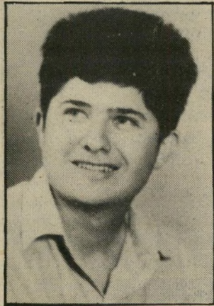
קורא לירון 72 כספ

קברניטי המדינה היו מוסיסים יותר כבוד לעצמם, אילו הסתפקו