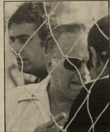
מנהל ניפוןב ויכוחים לגיטימיים