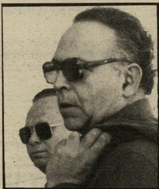
מוזכיר אפשטיין המעמד מתערער

לנבחרת. זה נכון שיש לו ירידה היום בכושר, אבל יש לזה סיבות אובייקטיביות. נעזור לו לחזור לימים הטובים שלו, כמו שעורנו לו בעבר, כי הפועל תל-אביב זה הבית שלו.