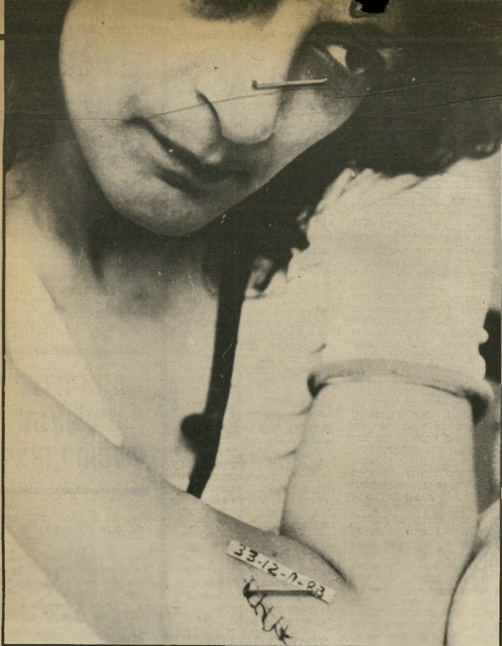
עדת־ראייה חווה קטלן שלוש דקירות בחזה