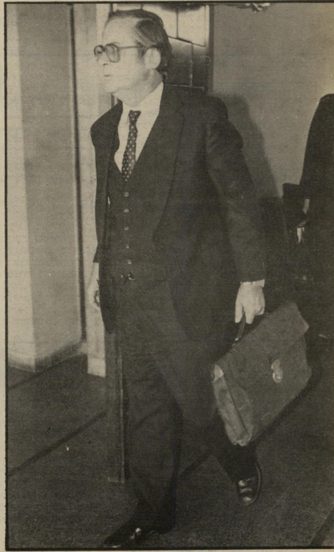
סרקליט גולדסארב הרבה זהב