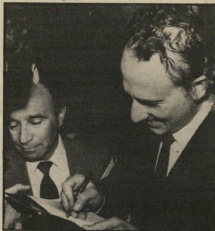
פסנתרן פוליני רגישות, חוכמה והשראה

הרי נגינת מאוריציו פוליני מתנגנים עדיין באוויר תל-אביב. מי שנכח בריטל שהעניק (והעניק) היא המילה המתאימה) אמן