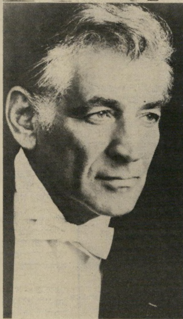
מנצח ברנשטיין מחמאה

ההפקה היא של בארי ג'יב, מבי-ג'יס. את כל הקטעים, פרט לאחד, כתב בשיתוף עם שני אחיו ללהקה או עם אלבי גלאוטן, מעבד וקלידן. בין הנגנים מוצאים את סטיב גאר בתופים וריצ'רד טי בפסנתר. ההקלטות עשירות בנגנים ומאוד מלוטשות. דיון ורוויק תמיד שרה טוב ומלא ובררר-כלל גם החומר היה מעניין. הפעם זהו תקליט בי-ג'יס בתחושת. ורוויק יכלה לוותר על ההרפתקה הזו.