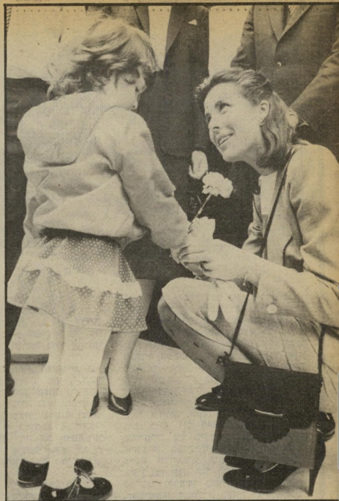
הנסיכה קארולין: ללא חילים