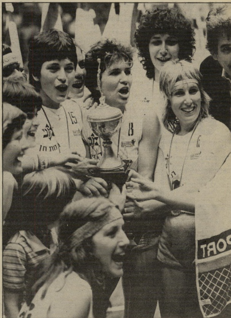
כדורסלניות מכבי רמת-גן עם גביע המדינה בלי כסף

אנשי הפועל סבורים שלאור היכולת הטובה שגילתה לפתע הקבוצה במישחק כולו מול מכבי, היא היתה יכולה לזכות