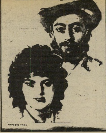
"העולם הזה" 1073 תאריך: 23.4.1958

הגרעונים נשאו מחוסרי פרנסה ובעלי בתי-הקולנוע הצטופפו במישרדי אירגון ניהם. עישנו בעצבות וצעקו בקוליקור לות: הפעם לא ניכנעו! אף אחד משני הצדדים לא התכונן להי-כנע. במישרדי-האוצר בירושלים נעצו חי פקידים מבט אטום בניצוגי בעלי בתי-הקור לנוע. שטענו לפניהם בהתרגשות רבה, והפסירו בחוסר-עניין: "אין מה לעשות. אי-אפשר להוריד את המיסים - התקציב כבר אישר בכנסת!" בתליאביב הודיעו נציגי אירגון בעלי בתי-הקולנוע למנהלי התיאטרונים: "אנחנו לא נציג ואתם לא תציגו. אף אחד לא יציג!"