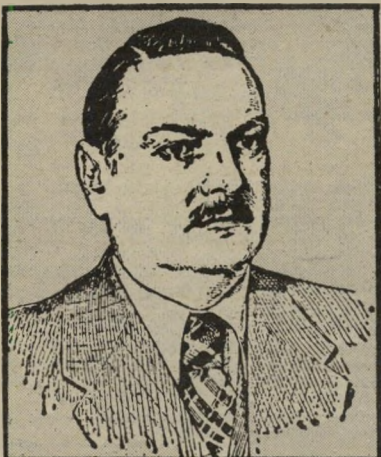
מכוונת-תרבות ז'דאנוב, דבר, מהפך ואנכרוניזם

קריאה בתרבות וחינוך מוליכה את ה-קורא למסקנה שבדרך ובהסתדרות טרם שמעו על המהפך הם מאמינים עדיין שהם „בעלי-הבית” והז'דאנובים המקומיים, אותיהם עובדי הוועד-הפועל ממשיכים ל-מלא עמוד זה בדבר כמו באותם ימים רחוקים.