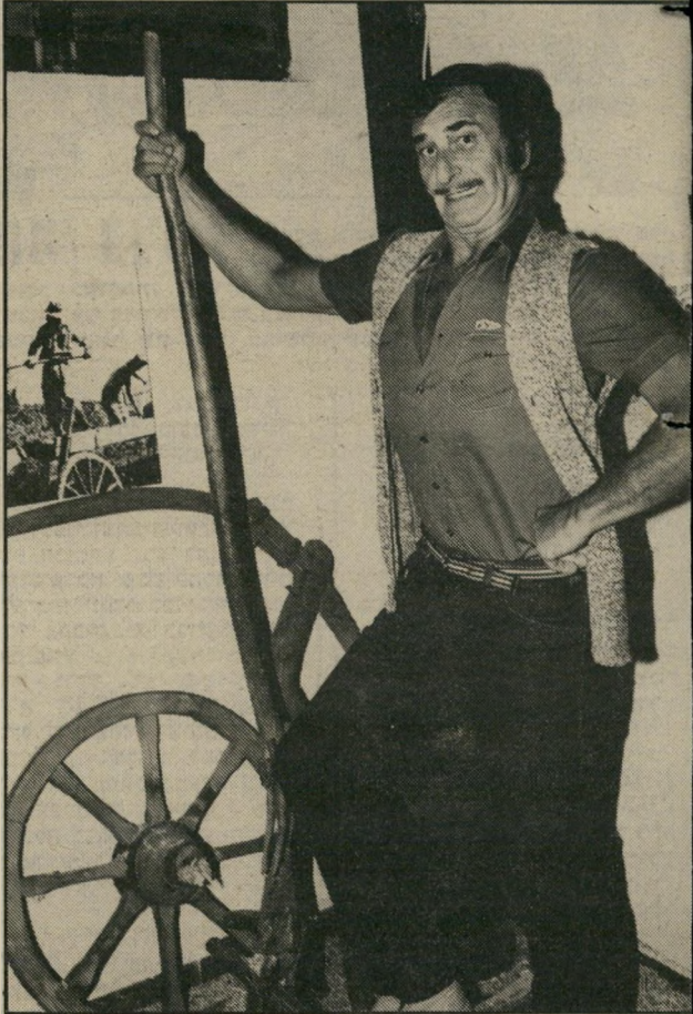
מחקה את האיכר המופיע בתמונה, כשהוא מדגים פוזת של יהודי בארץ, תחילת המאה. הוא צולם במועדון בתל-אביב, שברוח הנוס-טלגיה של ימים אלה, מילא את האולם בציוד חקלאי ישן.