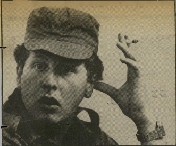
חשוד שחטמן פקידים במכוניות פאר