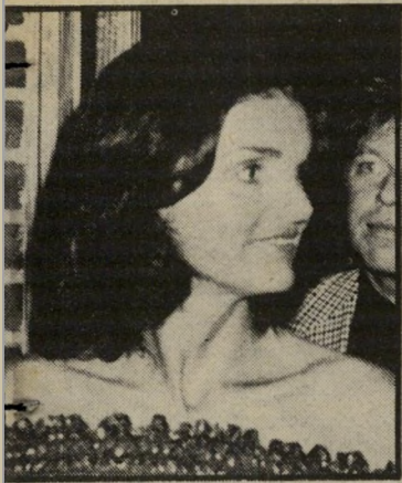
ג'קלין ג'קלין קנדי זכתה להבחר רק בתקור פות שבהן היתה נשיא ארצות הברית ואשתו של אונסיט.