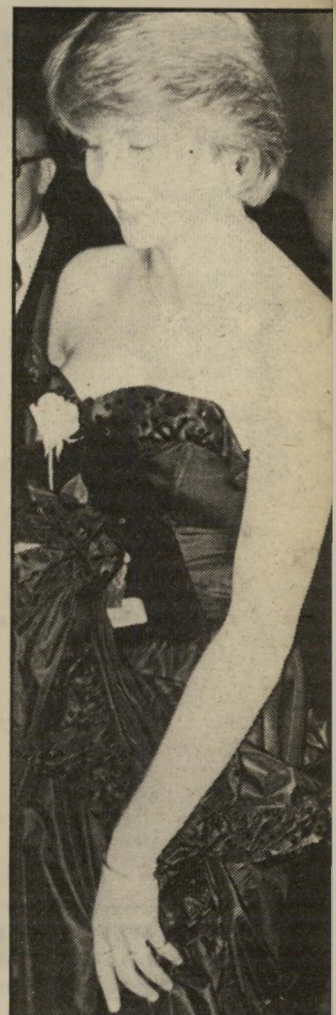
דיאנה הנסיכה דיאנה זכתה להיבחר השנה בין הנשים האלגנטיות ביותר.

לדעתי הצעירה האמריקאית, יפה ואלגנטית יותר מהצרפתייה, אבל הצרפתיות המבוגרות עולות על כל הנשים. הן פשוט לא מפסיקות לטפח את עצמן.