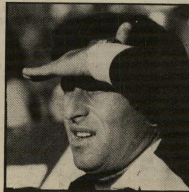
מאמן זלצר מאמן זלצר חוזה בדולרים

ה שמועות טוענות, שרייד שוויצר הוא המאמן היקר בישראל. בדיקה העלתה שהדבר לא מדויק. (דוביד) שוויצר מופיע רק במקום הרביעי. מקדי מים אותו שלושה מאמנים בכירים אחרים.