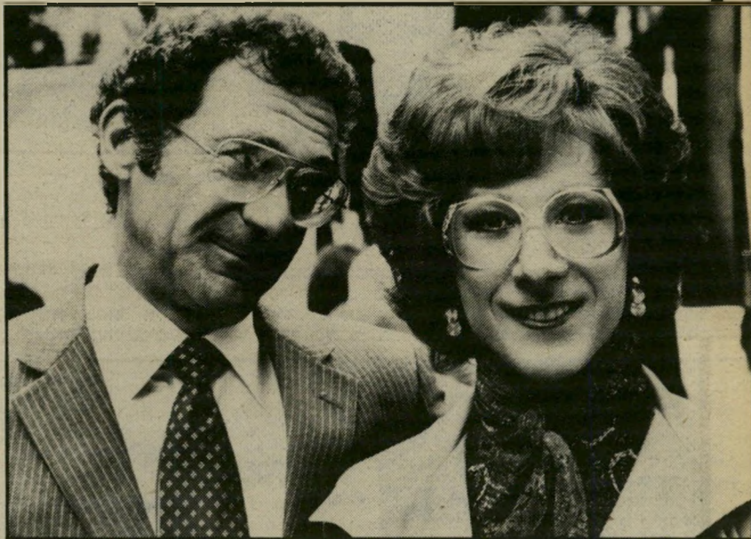
הבימאי סידני פולאק משחק את תפקידו של ג'ורג' פילדס, סוכן-שחקנים רב-השפעה בניו-יורק. דאסטין הופמן מככב כמייקל דורסי — שחקן מסור הנאבק על הקריירה שלו ומצליח לזכות בתפקיד רק כאשר.

לכן, למרות ההצטננות, למרות לחץ המראיינים שסחטו אותו קודם ואלה המח' כים בתור, הוא יכול להתרווח בניחותה בתוך הכורסא ולדבר איתי על סירטו, כמו היינו יושבים תחת עץ-בננות ומגלג' לים שיחותייך על החיים היפים.