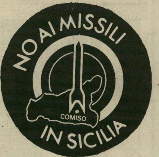
פמל תנועת-ההתנגדות להצבת הטילים לנוע או לעכב

עוד השנה. בוזשינגטון מעריכים שהכור באיסי-לאמאבד אומנם ייהרס עוד השנה. כוחה של השדולה הביטחוניסטית בישראל תמיד עולה על זו של השדר