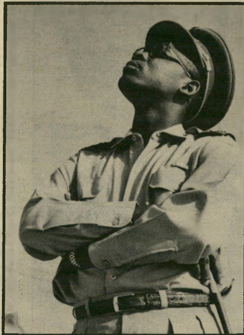
שליט זאיר מובוטו הסוף קרב

המילכוד עבור מובוטו, לדברי הירחון, הוא חמור. דרום-אפריקה דורשת מחיר כבד עבור הסיוע הכלכלי לזאיר - הכרה דיפלומטית. צעד כזה של מובוטו עשוי להביא לבידודו המוחלט באפריקה, ואף למילחמה נגדו. שתגרור מרידה פנימית וקץ שילטונו. משקיסם סבורים ששליט זאיר המושחת והעריץ יודח בתקופה הקרובה בכל מיקרה, וההשקעות הענקיות של ישראל בזאיר יירדו (שוב) לסמיון.