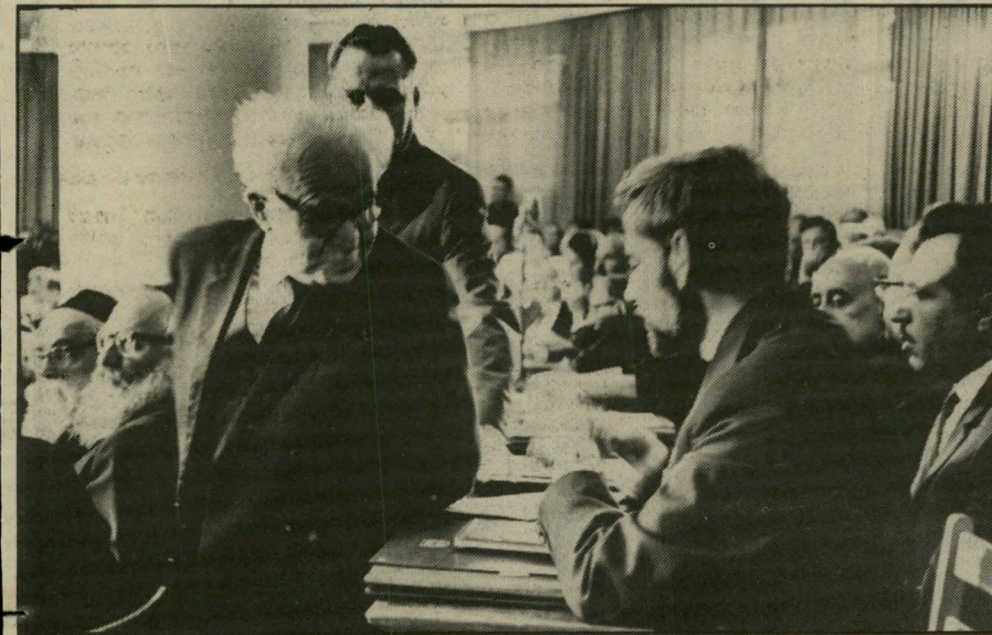
אורי אבנרי ביומו הראשון בכנסת, 1965 — ותיקות לשינוי

זהו שלב נוסף בהתפתחות רעיון, שהתל מופץ עליידי קבוצה גזענית קטנה, ובשנים האחרונות קונה לו אהדים רבים, חלקם עדיין מתי ביישים להודות בכך, וחלקם כבר מודים בכך בפה מלא, ומקבלים גיבוי ולגיטימציה מבעלי-סמכות שונים — רבנים, אנשי-צבא בכירי רים, סוליטיקאים ואנשי אקדמיה בעלי אורינטציה לאומנית.