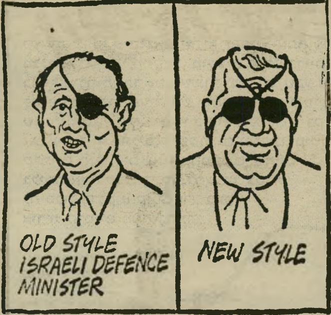
קריקטורה של מנדברג בעיתון אוסטרלי תרומת הקורא ויינשטיין

(המשך עממוד 20) עם שאר מילחמות ישראל - אסור לשכוח את כל אלה. מאיר פיינצק , תל-אביב ● ● ● ..הסיגנון והחשי תרומה מהיבשת החמי שית. קריקטורה זו קיבלתי מאוסטרליה