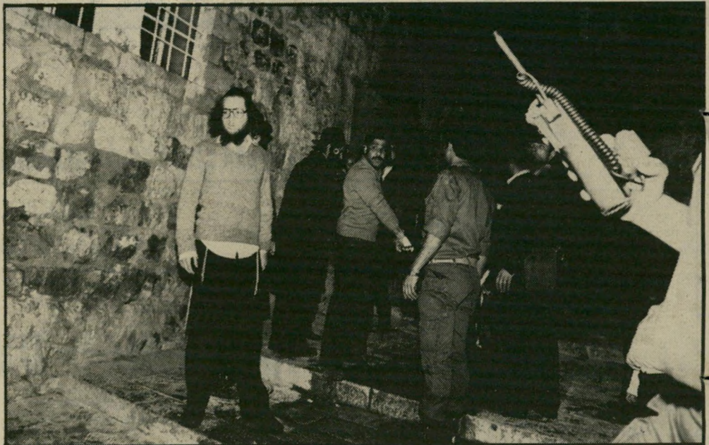
חסידו ישיבת "בירכת אברהם" בעת מעצרים היכו וחזרו להתפלל

במיטרת עבודתו העיתונאית הוא נפגש עם אישים שונים ונהג איתם סקטיקה דומה: הוא הזמין אותם לביתו כשהוא מבטיח אירוח