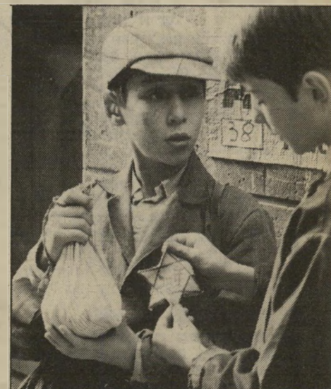
"שק של גולות" — ז'אק דאיון לא הופץ בישראל

קישוט הרומה לבארדו. בשעתו חלשו על הזכויות להסרטה ספריו של פלמינג האדונים אלברט ברוקולי הארי זלצמן. לפני כמה שנים טרש זלצמן מן השותפות וברוקולי המשיך להפיק את מותחני-בונד לבדו, כולל הסרט האחרון בסידרה אוקטופוס (המופץ על-ידי חברת יונייטד ארטיסטס). אלא שכל ספרי בונד של פלמינג הוסרטו זה מכבר, וחברה אמריקה גדולה, שגילתה כי על זכויות כדור הרעם (שהיה הרביעי בסידרת סירטי בונד) שולטים נוסף לברוקולי גם שני בעלי-זכויות אחרים, הגתה את הרעיון