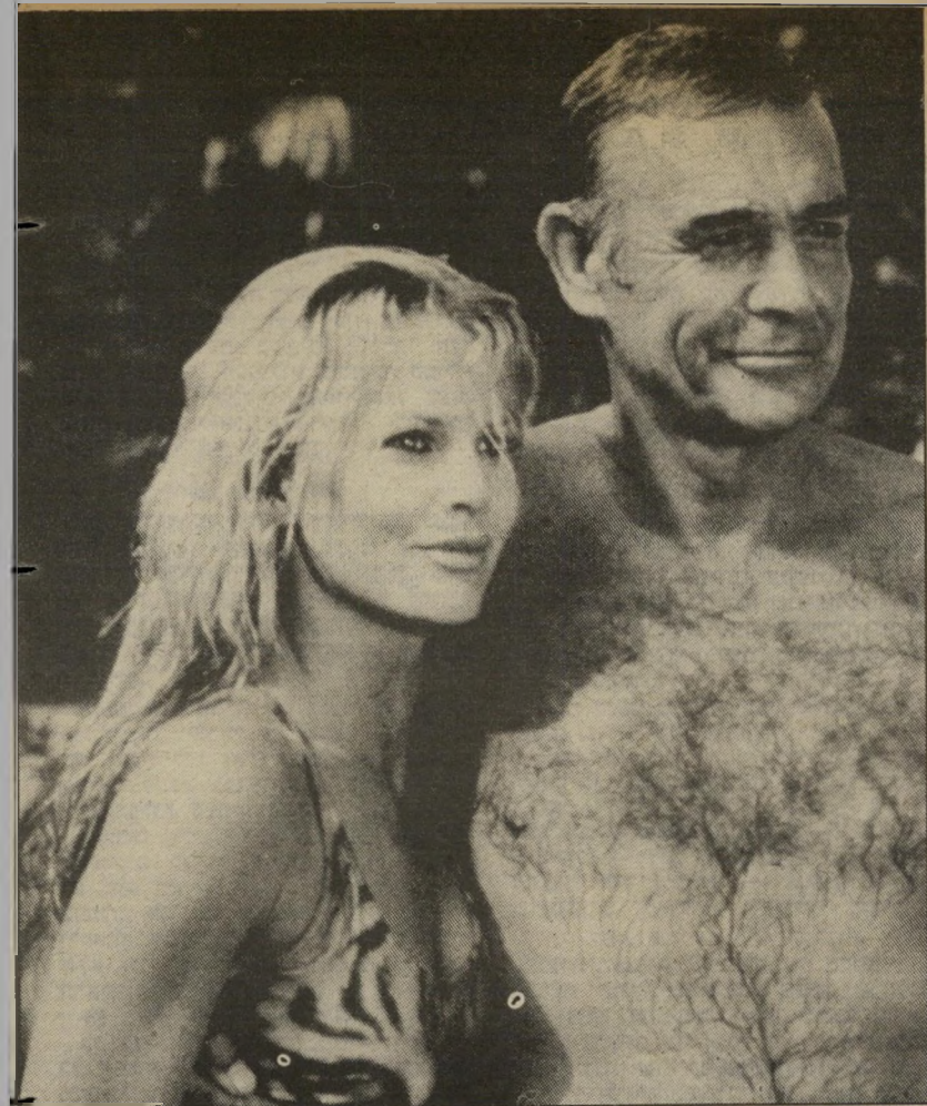
שון קונרי חוזר לבד כג'יימס בונד בחברת קים באסינגר תגלית דמויית בריגיט