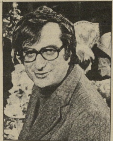
בימאי ברטראן טאברניה, שבוע של חופשה

זה אחד הסרטים המוצלחים ביותר שלו, אולם לא סרט זה ואף לא אחרים (כולל