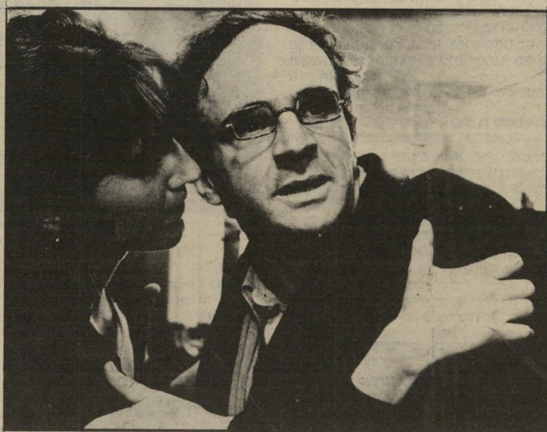
נאטלי באי עם הבימאי פרנסואה טריפו ב"החזר היוק" מזור, קודר, מרתק

פיאלא הוא בימאי שוליים בצרפת, הי מסרב להשתלב בזרם כלשהו או לשתף פעולה עם חברים למיקצוע. הוא הולך