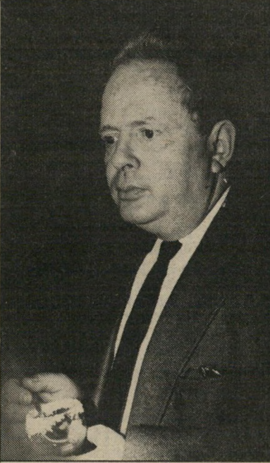
מנכ"ל לפיד שואה

● למערכת החדשות שהתעלמה כליל מאחד המאורעות החשובים החזותיים ב-