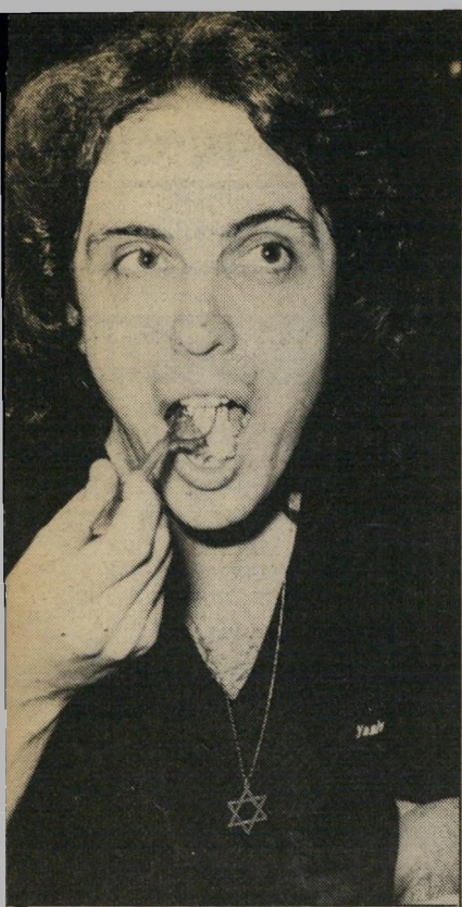
זמר פיק אכל אותה?

ניתו-הלהיטים בטלוויזיה, שאמר: "אם הי' כלל הנקוט אצל ועדת-הלשון של רשות השידור הוא 'עברית נכונה', הרי שבמק-ביל עליה להטיל הוראה, שתאסור על רוב המדינאים והברי-הכנסת מלהופיע ב' כליה-תיקשורת הממלכתיים!"