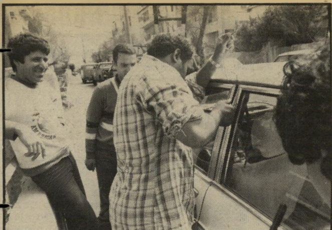
הפורץ מנסה לפתוח את המכונית - בואו נזח

לא מכבר שב שיק מסיור ארוך באירופה, שבו חילק את זמנו בין הפועות בכנסים על ספאסיסטים, הומניסטיסטים, חסידי שלום למיזרח-התיכון ופרלמנט עולמי זמני של