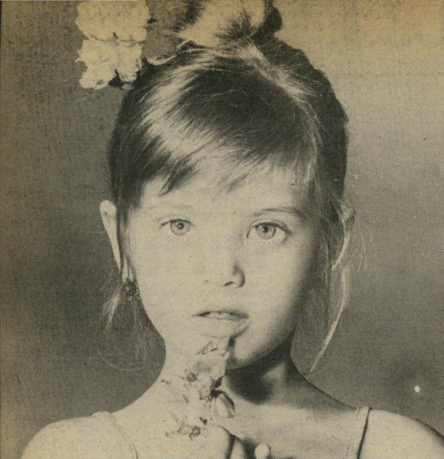
תלמידה גלה טיילור — רגישות לפניצילין

טרזה צבאית-חוקרת. תוצאותיה היו מגירת התיק, אחרי שהעולם הזה פנה בזמנו אל דובר צה"ל, נמסר שהתיק הוצא לבדיקה נוספת בפרי-קליטות הצבאיות.