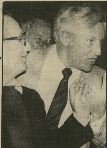
מועמדים להט ובן-מאיר עימות תרבותי

את סכום הכסף שנקבל עבור המכונה נעביר לקרן ע"ש עורך הדין דיינוד טורסטין, שנפל ב- מלחמת הלבנון. להתקשר לסלפונים: גא 03-239480 או 03-951149. לי טורסטין, תל-אביב