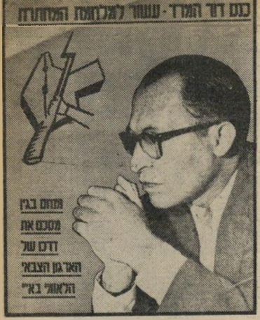
"העולם הזה" 1071 תאריך: 8.4.1958

בחיי הארץ. אבל מאחר שערכי רגיל אינו נבדל בחינוכיותו מיהודי רגיל, החל-טנו לחבוש כופייה." כתנועה מאורגנים כיום כמה מאות צעירי רים ערביים ברחבי הארץ, ועיקר כוחה ביציאת חברה למשקי השומר הצעיר, שם הם עוברים הכשרה מיקצועית, לומדים להכיר מקרוב את ההווה העברי.