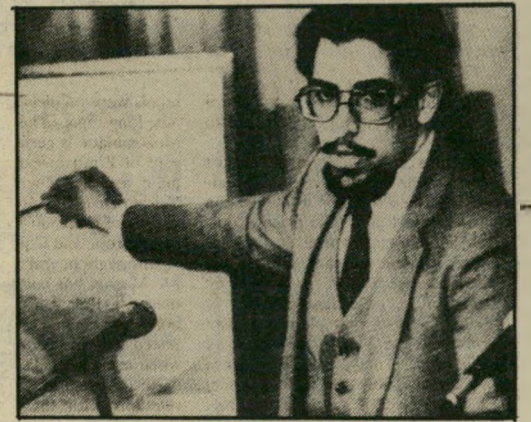
נציג ניקראגוואה באו"ם מתלונן העם תומך בסאנדיניסטים

בראיונות לעיתונים באירופה מדגישים הסאנדיניסטים את מעורבותה של ישראל בהכנות המילחמיות נגד ארצם. ישראל היא כיום המדינה השנואה ביותר בניקראגוואה. אורחי המדינה המרכז-אמריקאית הרחוקה מאשי-מים את ממשלות ישראל בסיוע צבאי מאסיבי למישטר הקודם, שהגן בכוח הנשק, העניינים והעוצאות להורג, על האינטרסים הכלכליים של שיכבה דקה ביותר במדינה. כל המומחים בנושא דרום-אמריקה תמימי דעים שישאל הגישה סיוע צבאי עצום לסומוסה, גם אחרי שהנשיא ג'ימי קארטר הטיל אמברגו על אספקת-נשק למרצחים