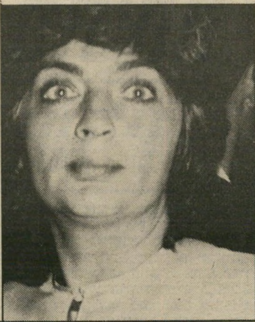
מנהלת-תוכניות פאר רכישה של רמטכ"ל יוצא