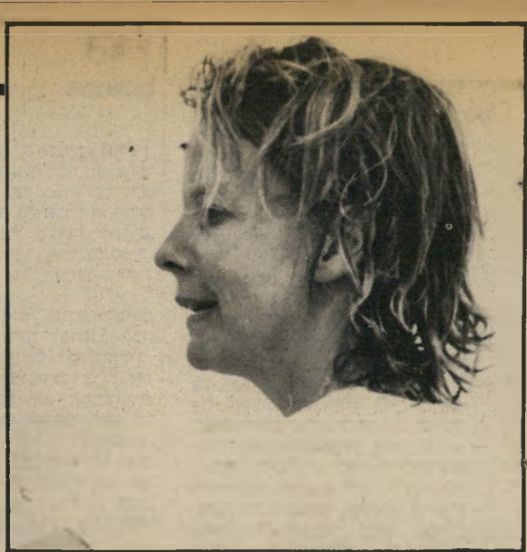
הטבח היה עלי. איתו היה הכל אחרת. היתה לו תפיסה אחרת של אבהות. עמדתי איתו בקשר הדוק מאוד עד יום מותו.